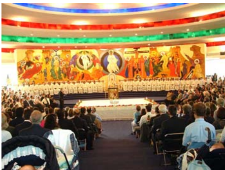
Figura 12. Fermo, Chiesa Neocatecumenale, equipe di Kiko Arguello

Assenza di immagini, che si richiama fundamentalmente ai grandi esempi formulati dai grandi architetti (Aalto, Michelucci, Le Courbousier). In questi edifici di culto sono lo spazio e la luce a sostituirsi alla presenza di immagini, a volte può essere introdotto il crocifisso e collocato o sopra l'altare o nello spazio absidale, reminiscenza del periodo gotico. Estendendo il concetto si potrebbe paragonare questi edifici alla concezione metafisica dello spazio sacro, e di cui si potrebbero dare le stesse valutazioni formali.