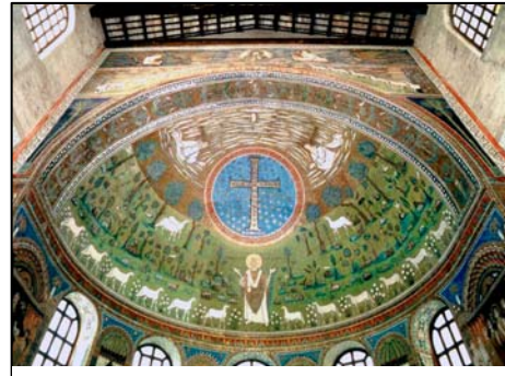
Figura 1. Ravenna Sant'Apollinare in Classe

L'arco trionfale (S. Apollinare in Classe) come indicazione trascendente o indicazione finale del percorso (figura 1)