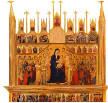
Figura 5. Duccio Di Buoninsegna, Maestà, Opera del Duomo

La figura della Madre di Dio, assume un ruolo simbolico diverso, sotto a spinta di una nuova spiritualità che ama sentire Dio vicino e appassionato la Madre di Dio nell'immagine dialogica elaborata nel Dugento in Toscana e in Umbria. Il nome stesso varierà: la si chiamerà "Madonna". Il fedele ama sentirsi come un bambino in braccio ad una madre che intercede per lui. Queste madonne saranno progressivamente collocate nell'abside come pale d'altare. La Maestà di Duccio collocata nel Duomo di Siena, rappresenta emblematicamente questo tipo di dipinti (figura 5)