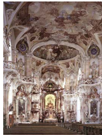
Figura 8. Bernau, Unsere Liebe frau, interno

Il Barocco presenta una nuova funzione del ciclo iconografico, suggerendo una funzione illusionistica dell'immagine. Questo aspetto porterà di fatto ad una divaricazione ulteriore fra il luogo di culto e la celebrazione stessa.