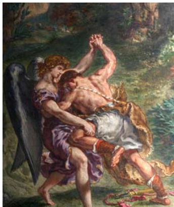
Figura 10. Parigi, Saint Sulpice, E. Delacroix, Giacobbe e l'Angelo

Il neoclassico presenterà una pluralità di stili, poiché si appellerà al Paleocristiano, al gotico, al rinascimentale e al barocco, ripresentandolo come un neo-. Questi edifici di culto riformulano l'idea primigenia del luogo di culto cui fanno riferimento, ma l'accostamento del ciclo iconografico li rende degli ibridi illeggibili. Ad esempio, entro luoghi di culto ad impianto neobasilicale, si inseriscono cicli pittorici che si rifanno al rinascimento o al barocco, con l'evidente risultato di tornare illeggibili e non fruibili per la lettura liturgica e contestuale