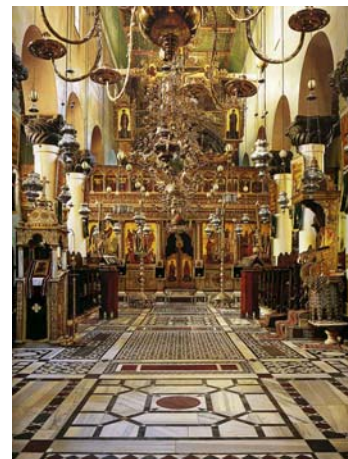
Figura 2. Santa Caterina del Sinai, Chiesa (interno)

L'immagine di una Chiesa del complesso di Santa Caterina del Sinai 7 , di impianto nativo risalente al IV secolo, ed esempio pressochè unico di custodia nel tempo, grazie alla posizione defilata, può rendere figurativamente un edificio di culto del periodo basilicale. Dal punto di vista iconografico quindi al ciclo monumentale fisso, va pensata l'iconostasi e il suo corredo di immagini variabili legate all'anno liturgico. (figura 2)