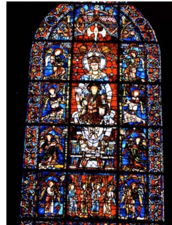
Figura 3. Chartres, Cattedrale, Vetrata dell'Odighitria

Questi edifici di culto si propongono come indicazioni di alterità; come il fedele entrando attraverso il portale viene accolto dalla Chiesa celeste e immesso in uno spazio sacro perché "altro" da ciò che lo circonda, la luce passando attraverso la vetrata diventa "sacra", perché perde la sua connotazione di luce naturale (figura 3).