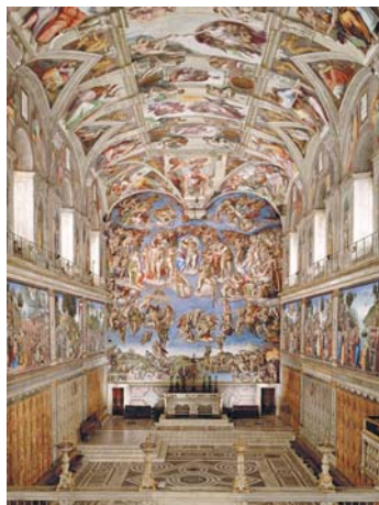
Figura 7. Roma, Cappella Sistina

L'altare centrale o privilegiato, non segue uno schema univoco, a volte mantiene la croce sospesa sopra l'altare, a volte la pala d'altare viene sostituita da cicli completi (in genere relativi alla vita della Madonna). Vale lo stesso di quanto detto in precedenza, l'immagine qui cerca di entrare in dialogo con il fedele attraverso l'evocazione e cerca di generare sentimenti di devozione.