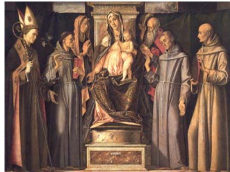
Figura 6. Alvise Vivarini, Sacra Conversazione, Padova

La pala d'altare già inserita nel gotico diviene in questo periodo il fuoco dominante delle cappelle laterali, viene formulata progressivamente la composizione della "Sacra conversazione", composta formalmente dalla Madonna con Bambino al centro e attorniata da Santi (in genere i protettori, a volte appaiono anche i committenti), dipinta con una prospettiva particolare per evocare un collegamento con la comunità raccolta attorno al Sacerdote e all'altare (figura 6). Questo tipo di dipinti ha una funzione evocativa perché cerca di attrarre il fedele entro un riconoscimento di appartenenza con la chiesa trionfante dei cieli.