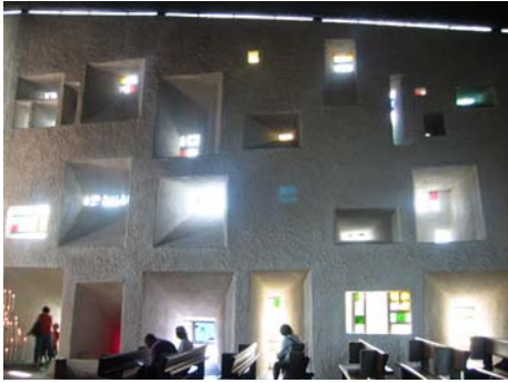
Figura 11. Ronchamps, Notre Dame du Haut, Le Courbousier

L'elemento della luce sembra supplire all'assenza di immagini. Le Courbousier utilizza ad esempio nelle cappelle per la celebrazione privata un camino che sovrasta l'altare e che raccoglie una straordinaria intensità di luce nella piccola zona della celebrazione, indicando così la trascendenza del mistero, mentre all'interno della navata attinge luce attraverso piccole feritoie in vetro, che conferiscono internamente una luce appena accennata, ad indicare la quiete e la discrezione con cui il mistero si rende presente (figura 11), il luogo di culto esterno di Ronchamps