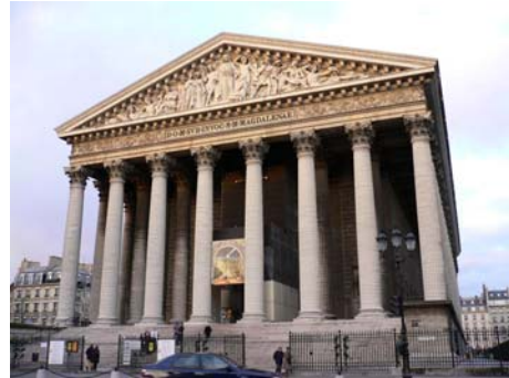
Figura 9. Parigi, La Madeleine, esterno

Esempio emblematico è la costruzione della chiesa della Madeleine a Parigi (figura 9), che ripropone